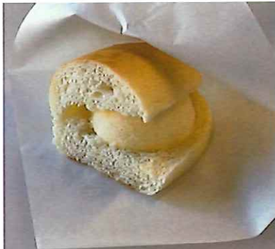
← アイスコッペパン 200円(税別)