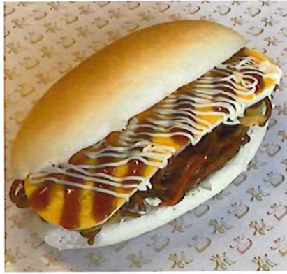
2位 広島お好み焼き 400円(税別) コッペパンに広島のソウルフード「お好み焼き」をはさんだ一品。