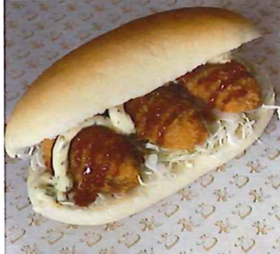
← カキフライコッペ 540円(税別) 広島といえばカキ! カキを使った 広島ならではのコッペ 8月~の新商品!