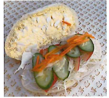
3位 季節野菜たまご 360円(税別) 地元の季節野菜とたまごサラダを組み合わせたコッペパン。