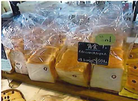
1位 角食パン 300円(税抜) もちり、しっとり！配合は企業秘密