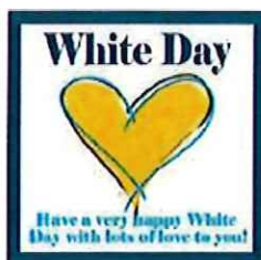
ホワイトデー ピック38mm×38mm