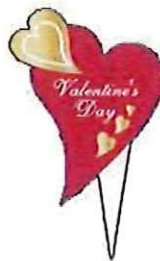
バレンタインデー ピック25mm×43mm