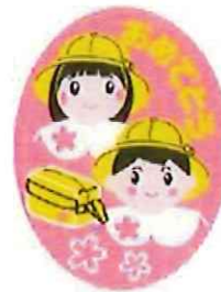
卒園・入園 シール30mm×40mm