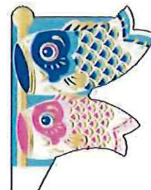
こどもの日 ピック40mm×66mm