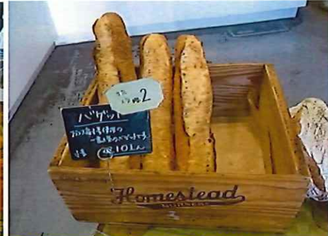
2位 バゲット 210円(税抜) フランス産の小麦を使用した商品