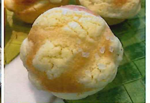
3位 メロンパン 160円(税抜) メロン皮にザラメの食感が楽しい、しっとりとしたメロンパン。