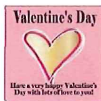
バレンタインデー シール30mm×30mm