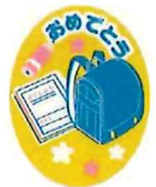
卒業・入学 シール30mm×40mm