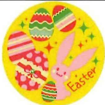
イースターシール 40φ 100枚/束