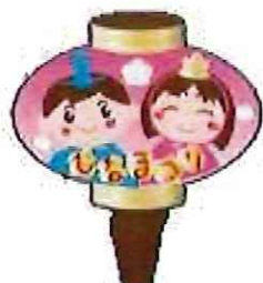
ひなまつり ピック25mm×35mm