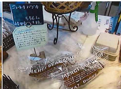
写真左 酵豆(こうず) 230円(税抜) 国産小麦100%の食事パン。フリーズドライの大豆粉を小麦粉にブレンドして、噛めば噛むほど味わい深い。外はパリッとして中はもちりしている。