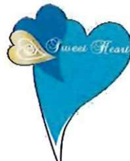
ホワイトデー ピック35mm×48mm