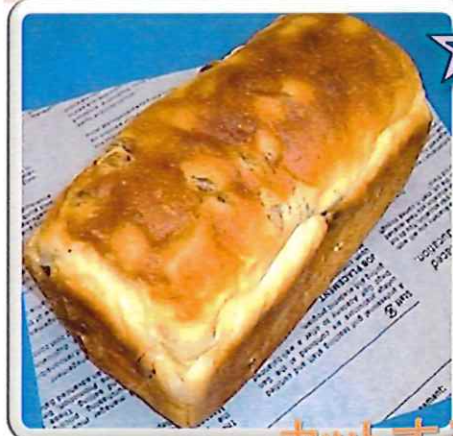
レーズン食パン 口の中がレーズンでいっぱいになるほど、たくさんレーズンが入っています。 ¥650(税込¥702) 1/2 ¥325(税込¥351)