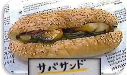
サバサンド 大層とサバの塩焼きとセロリトマトをサンド。 ¥380(税込¥410)