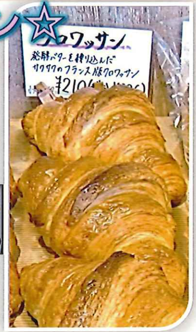
クロワッサン 発酵バターを練り込んだ、サクサクのフランス産小麦のクロワッサン ¥210(税込¥231)