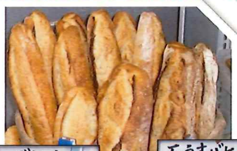
バケット フランス産小麦100%使用しています。バケットの通気性は最高です。パリッとした食感と香ばしいお味です。 ¥250(税込¥270) バターロール ¥250(税込¥270) 石うすバケット フランス産小麦100%使用です。おいしいです。香ばしいお味です。 ¥280(税込¥302)