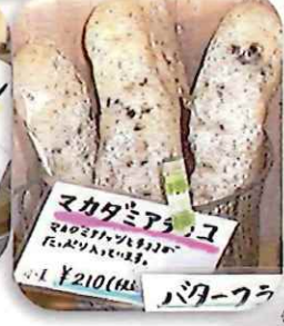
マカダミアナツコ ¥210(税込¥231)