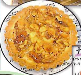
ナッツのマルト カンヌーナッツとマカダミアナツコとアーモンドくるみをお入れたマルト。 ¥310(税込¥334)