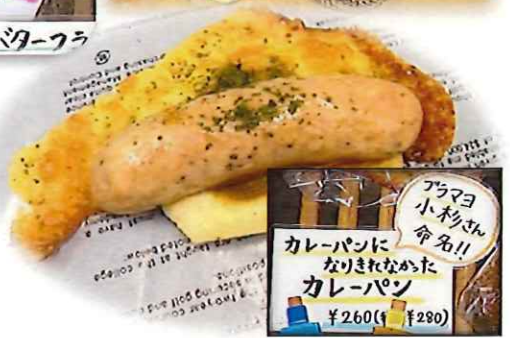
アラマヨ小ナツコ命名!! カレーパンになりきれなかったカレーパン ¥260(税込¥280)