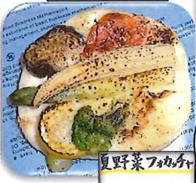
夏野菜フカチ ¥230(税込¥248)

揚げ物類のサンド(とんかつ、クリームコロッケ、コロッケ)は隣接する専門店から仕入れています。