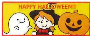
④-D ハロウィンシール ウィッチゴースト サイズ 50×20 入数 100枚/セット