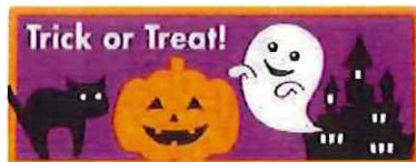
④-C ハロウィンシール レクタングル サイズ 50×20 入数 100枚/セット