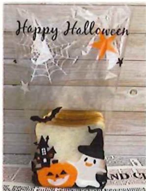
PP食パン横マチ1斤袋ハロウィン サイズ#25 (120+120)×380 入数 100枚/束