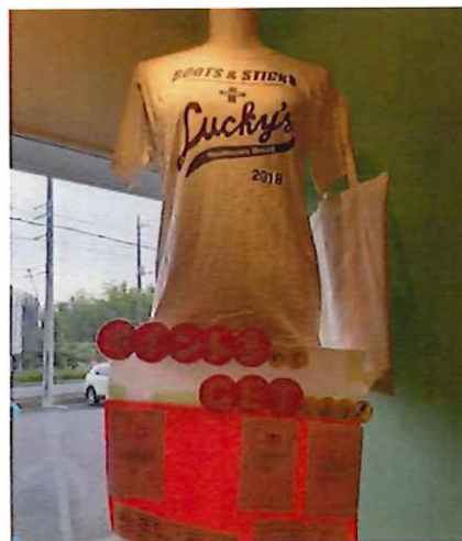
ポイント集めてTシャツGET