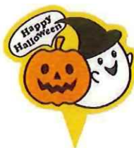
③-C ハロウィンピック ハロウィンフランス サイズ 33×31 入数 100枚/束