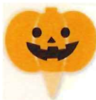
③-A ハロウィンピック フェイス サイズ 30×30 入数 100枚/束