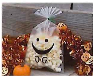
②-C マットOPPパックハロウィンゴースト サイズ#30×150×250 入数 100枚/束