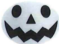
④-A 透明シール ジャックランタン サイズ 60×45 入数 100枚/セット