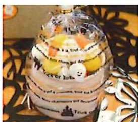
②-A OPPパックハロウィンパレード サイズ#30×120×200 入数 100枚/束