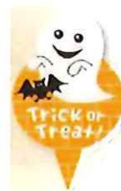
③-B ハロウィンピック ゴースト サイズ 23×38 入数 100枚/束