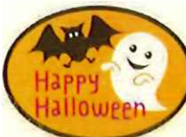
④-B ハロウィンシール オーバル サイズ 35×25 入数 100枚/セット