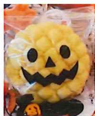
②-D OPPパックジャックランタン サイズ#30×150×250 入数 100枚/束