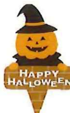
③-D ハロウィンピック パンプキン サイズ 43×26 入数 100枚/束