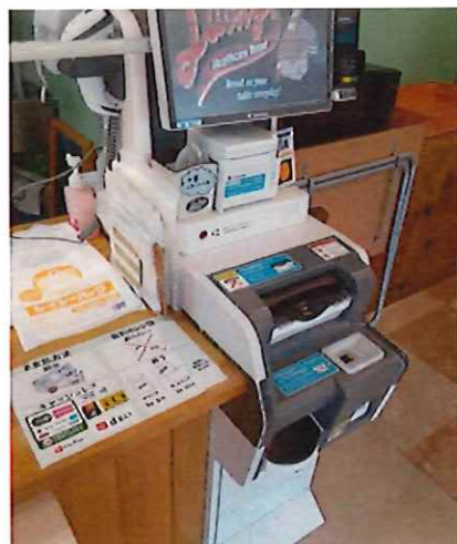
キャッシュレス対応レジ