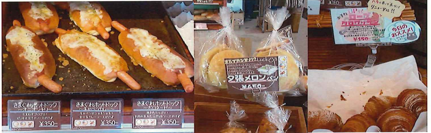
多彩なラインナップ