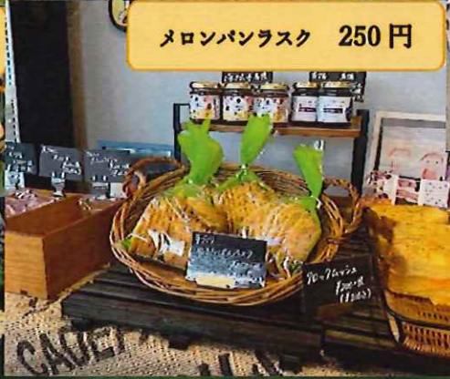
メロンパンラスク 250円