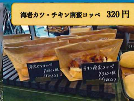
海老カツ・チキン南蛮コッペ 320円